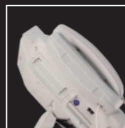
Couvercle qui s'ouvre par pression pour l'interrupteur d'alimentation