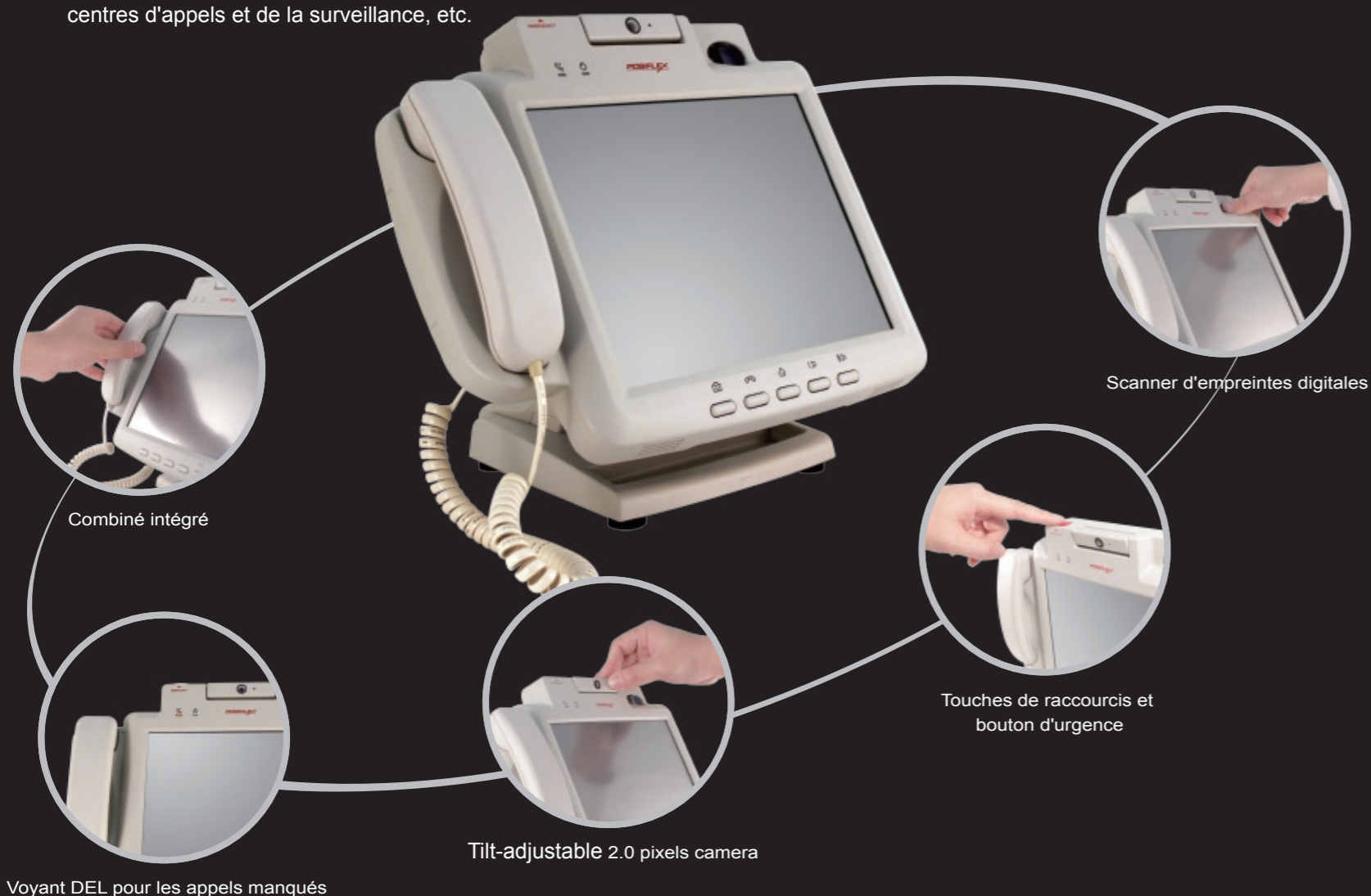
Voyant DEL pour les appels manqués

Le KS-6910HS avec ses formes douces et sa couleur blanc ivoire pourvoit à la recherche d'informations et à l'infodivertissement sur les marchés des maisons de soins, des hôpitaux, des centres d'appels et de la surveillance, etc.