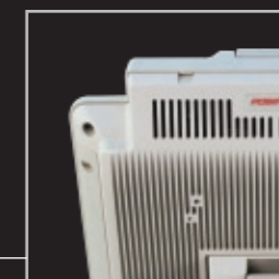
Conception en aluminium moulé brevetée permettant un refroidissement efficace