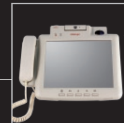
Option de montage mural